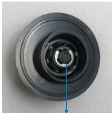
Sicherungsring mit Schraubenzieher Gr 1, erst nach Aussen schieben, dann entfernen