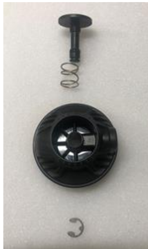
Feder und Druckknopf entfernen