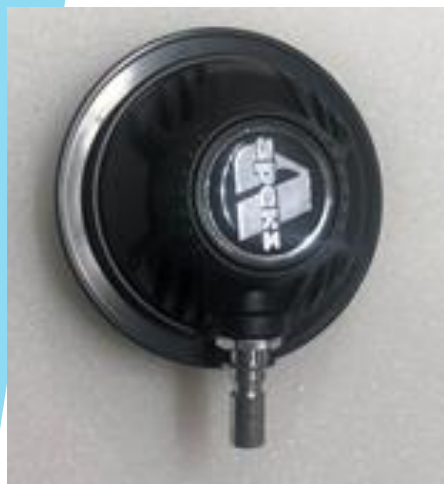
Inflator Nippel abschrauben